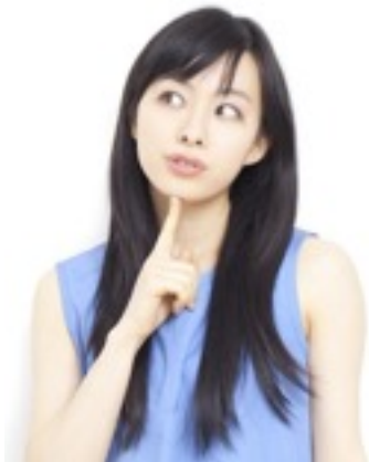
設置先サポーターさま